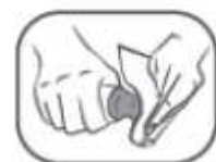
8. Bei Bedarf Applikator mit Papiertuch reinigen

Ziehen Sie vor der ersten Anwendung die transparente Schutzkappe von der Tube (Abb. 1) und drehen Sie den orangenen Applikator ab (Abb. 2). Nutzen Sie die sternförmige Vertiefung an der Seite des Applikators, um das Sicherheitssiegel der Tube zu entfernen (Abb. 3). Drehen Sie den Applikator wieder auf die Tube (Abb. 4) und ziehen Sie zum Öffnen den weißen Teil hoch (Abb. 5).