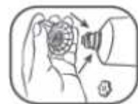
4. Applikator wieder auf die Tube drehen