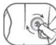
7. Applikator schließt sich beim Auftragen mit leichtem Druck automatisch