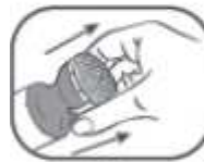
5. Zum Öffnen weißen Teil des Applikators hochziehen