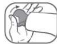
2. Applikator abdrehen