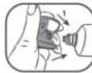
3. Mit seitlicher, sternförmiger Vertiefung das Sicherheitssiegel der Tube entfernen