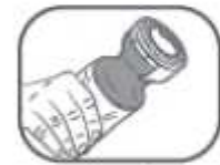
6. Für die erforderliche Schmerzgel-Menge Tube leicht zusammendrücken