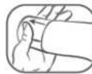
1. Transparente Schutzkappe abziehen